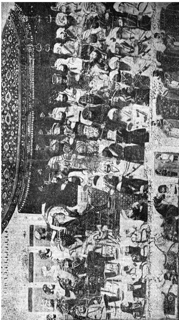
महाराजा रंजीतसिंह का दरबार